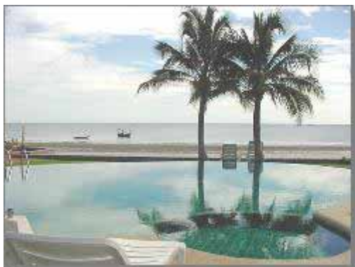
Takiab Beach / Pool