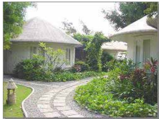
Kaban Tamor Resort