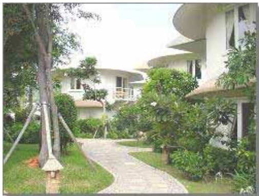
Kaban Tamor Resort

KABAN TAMOR RESORT , är ett litet exklusivt bungalowresort precis vid Takiab Beach. De trendiga, väldesignade rummen passar perfekt för smekmånadspar eller för den kräsne resenären. Då rummen är ganska stora, passar de även väl för familjer som behöver upp till två extrasängar. I anslutning till resortet ligger S'mor Spa Village, som erbjuder ett mycket fint Spa med en rad av avslappnande/förnygrande program.