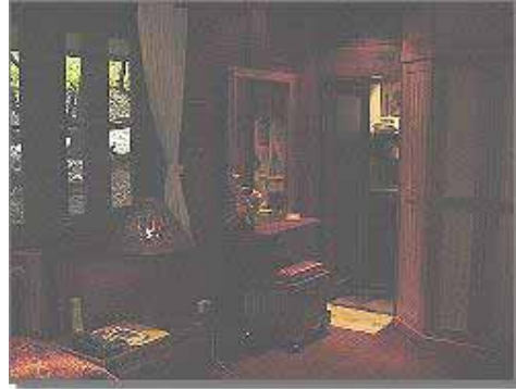
Standard Bungalow Rum