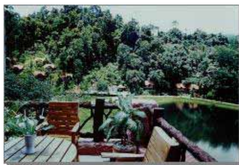
Utsikt över "golf" sjön