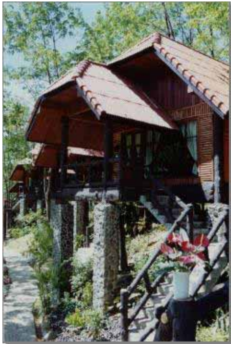
Deluxe Cabin Bungalow