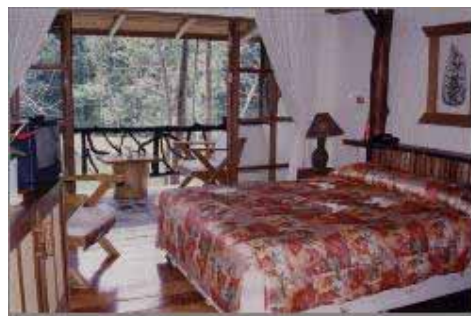
Dubbelsäng i Superior Room Huvudbyggnad