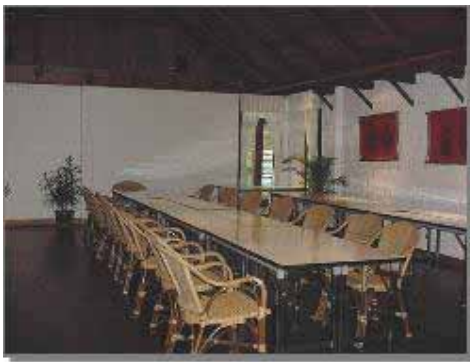
Konferensrum för < 60 personer