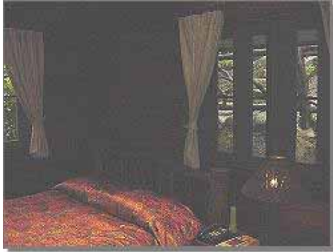
Standard Bungalow Rum