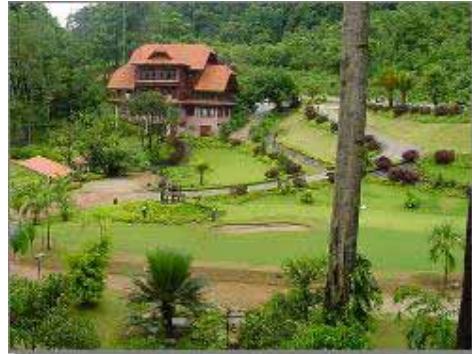
Reception & Huvudbyggnad