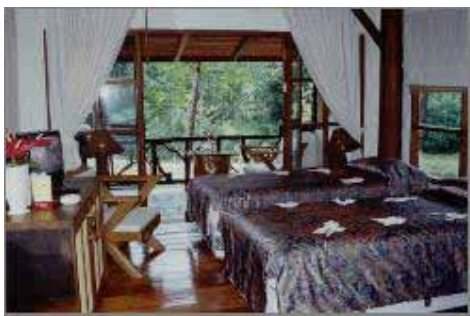
Enkelsängar i Superior Room Huvudbyggnaden