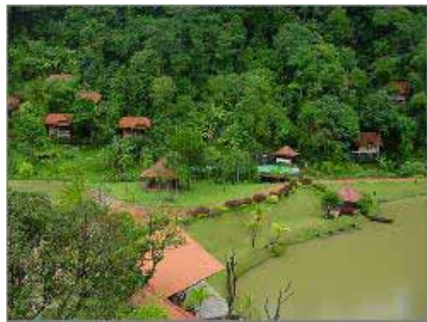
Utsikt från Receptionen