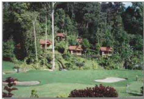
Standard & Cabin Bungalows på sluttningen vid putting greenen