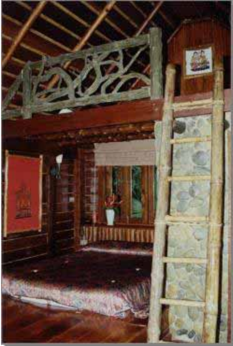
Deluxe Cabin Bungalow 2 nivåer - 4 personer