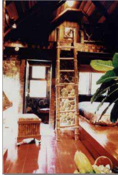
Deluxe Cabin Bungalow 2 nivåer - 4 personer