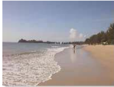
Klong Dao Beach