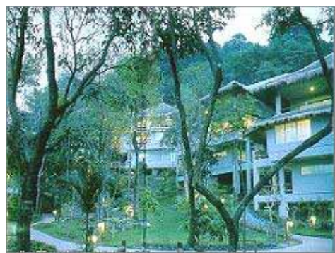
Ao Nang Pakasai Resort