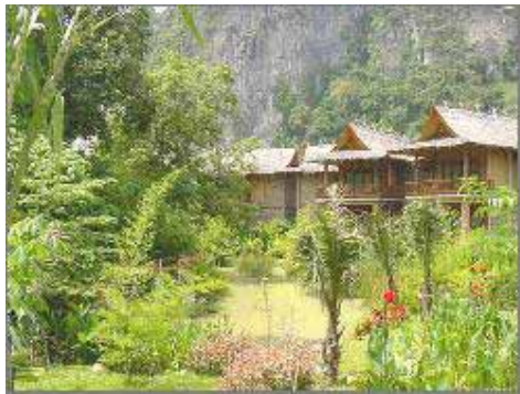
Hotellbyggnad och trädgård