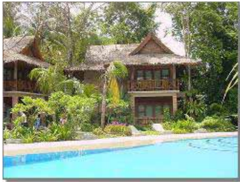
Pool Side Superior Rooms