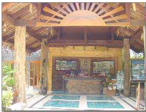
Somkiet Buri Resort Reception

Resortet ligger cirka 300 meter ifrån Ao Nang Beach. Det mest omtyckta hotellet under säsongen 2004/2005. Deluxerummet är perfekt för familjen med upp till tre barn.