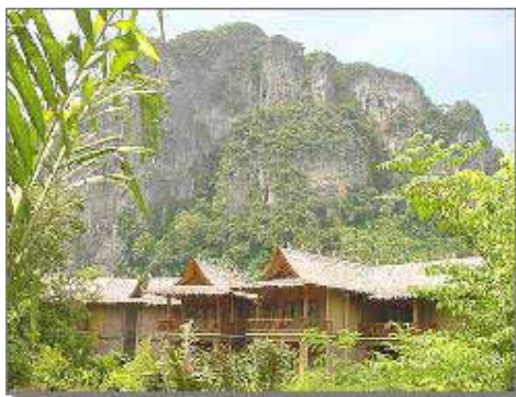
Hotellbyggnad med bergen