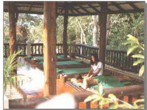
Thai massage område