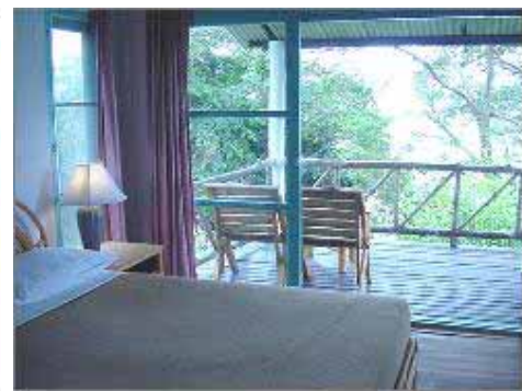
Deluxe Villa terrass