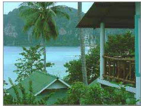
Utsikt från en bungalow