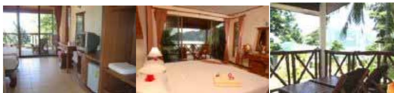
Araya Grand Deluxe