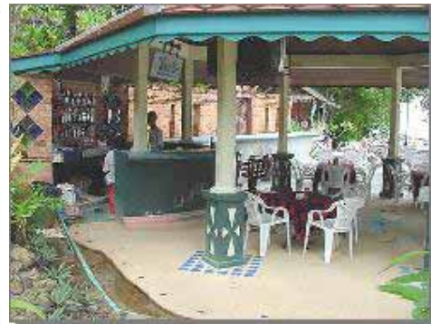
Bay View Resort Bar