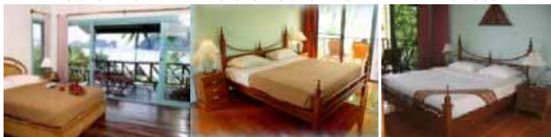
Grand Deluxe Villa