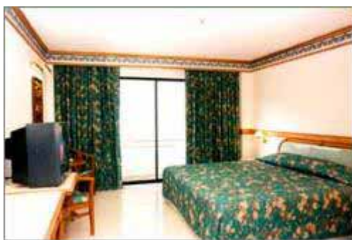
Mountain View Main Wing