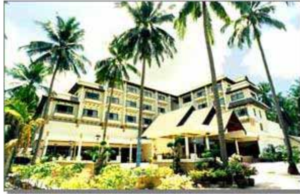
Phi Phi Hotel Main Wing

PHI PHI HOTEL , ກໍາລັງຕັ້ງຢູ່ໃນກາງຂອງເກາະນີ້ທີ່ງົບງຳ, ຢູ່ບາງຄາງ ທອນ ສາຍ ບາຍ, 100 ມາຕາກ ຈາກປາຍ, ທີ່ນີ້ມີເຮືອນທ່ອງທ່ຽວເຮັດວຽກຕໍ່ມາຕໍ່ມາ. Phi Phi Hotel ຕັ້ງຢູ່ກາງລະຫວ່າງ ທອນ ສາຍ ບາຍ ແລະ ໂລ-ດາ-ລຸມ ບາຍ ແລະ ມີຫ້ອງຕ່າງໆ, ຈາກ ຫ້ອງແຮມ ຫາ ຫ້ອງເຮັດວຽກ.