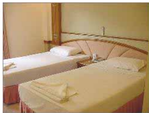
Air-con room New Wing