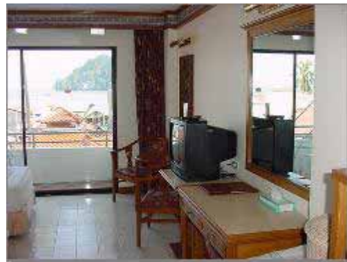
Sea View Room Main Wing