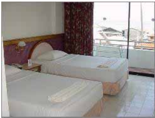
Sea View Room Main Wing