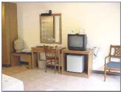
Air-con room New Wing