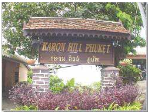
Baan Karon Hill

BAAN KARON HILL , ligger utspridd över en bergssluttning i norra ändan av Karon Beach. Utsikten från de flesta bungalows och rum samt poolområde är dramatiskt. Resortet är relativt enkelt i utförande och involverar en hel del nivåskillnader och trappor. Mindre lämpligt för småbarnsfamiljer och äldre. Här finns dock terrasser där man kan sitta med en drink i handen och se ut över den fina Karonstranden och det mäktiga Andaman Havet. Det tar cirka 5 minuter att gå ner till Karons norra strandända från poolen.