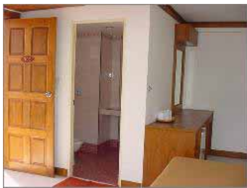
Superior Air-con Rum