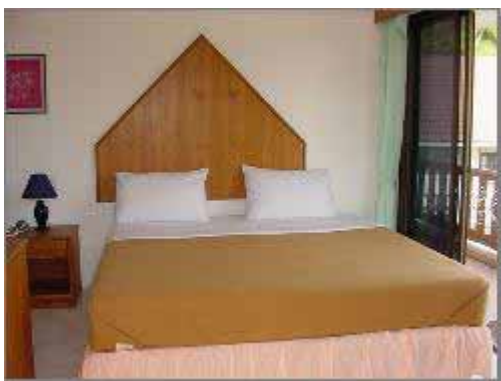
Superior Air-con Rum