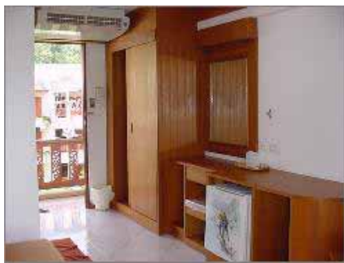
Standard Air-con Rum