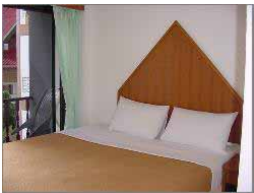
Standard Air-con Rum