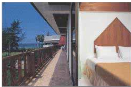
Havsutsikten ifrån översta våningen