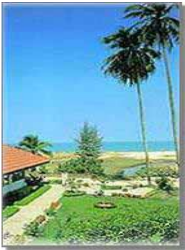
Utsikt från hotellet

PRINT KAMALA RESORT , hotellet nära stranden, är perfekt beläget på Phukets orörda strand Kamala Beach. Gömd bland palmer och en frodig tropisk trädgård, så erbjuder hotellet en rad olika bungalows och rum. Varje rum är utrustat med varmt & kallt vatten, kylskåp, minibar, TV och inställbar luftkonditionering. Hotellet har även en egen simbassäng. Kamalas lokalgata går mellan hotellet och stranden, som kan nås via en kort bro på andra sidan vägen. Phuket Kamala Resort är ett av de äldsta hotellen i Kamala och ser många återkommande gäster varje år. Hotellet blev helrenoverat under sommaren 2004.