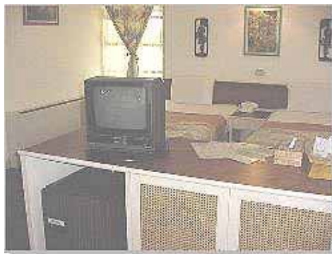
Bungalow Typ 1 Twin