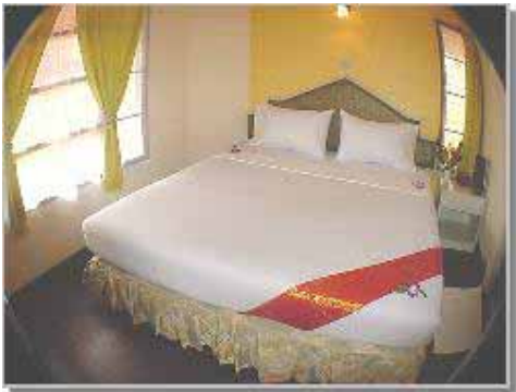
Bungalow Typ 2 Dubbel