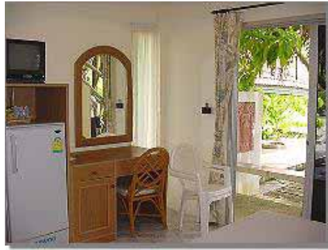
Poolside Cabana Rum