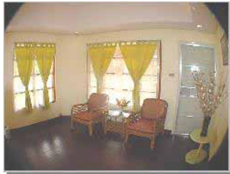
Bungalow Typ 2 Vardagsrum