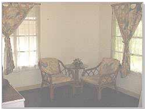
Bungalow Typ 1 Twin