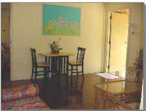
Bungalow Typ 2 Vardagsrum