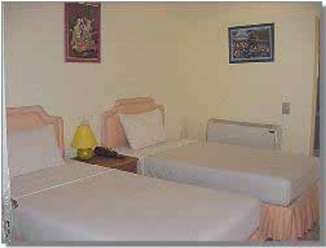
Poolside Cabana Twin Rum