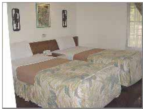
Bungalow Typ 1 Twin