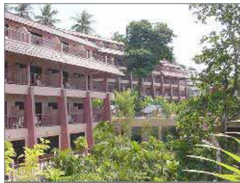
Superior & Deluxe Rum