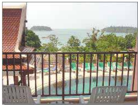
Balkongutsikt från Superiorrum