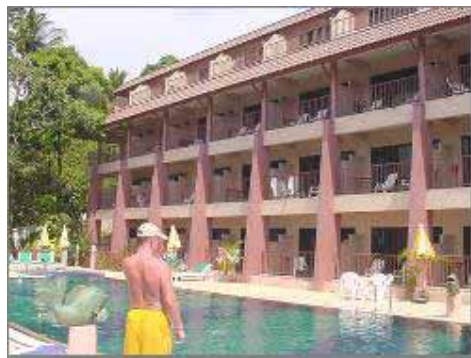
Superior & Deluxe Rum